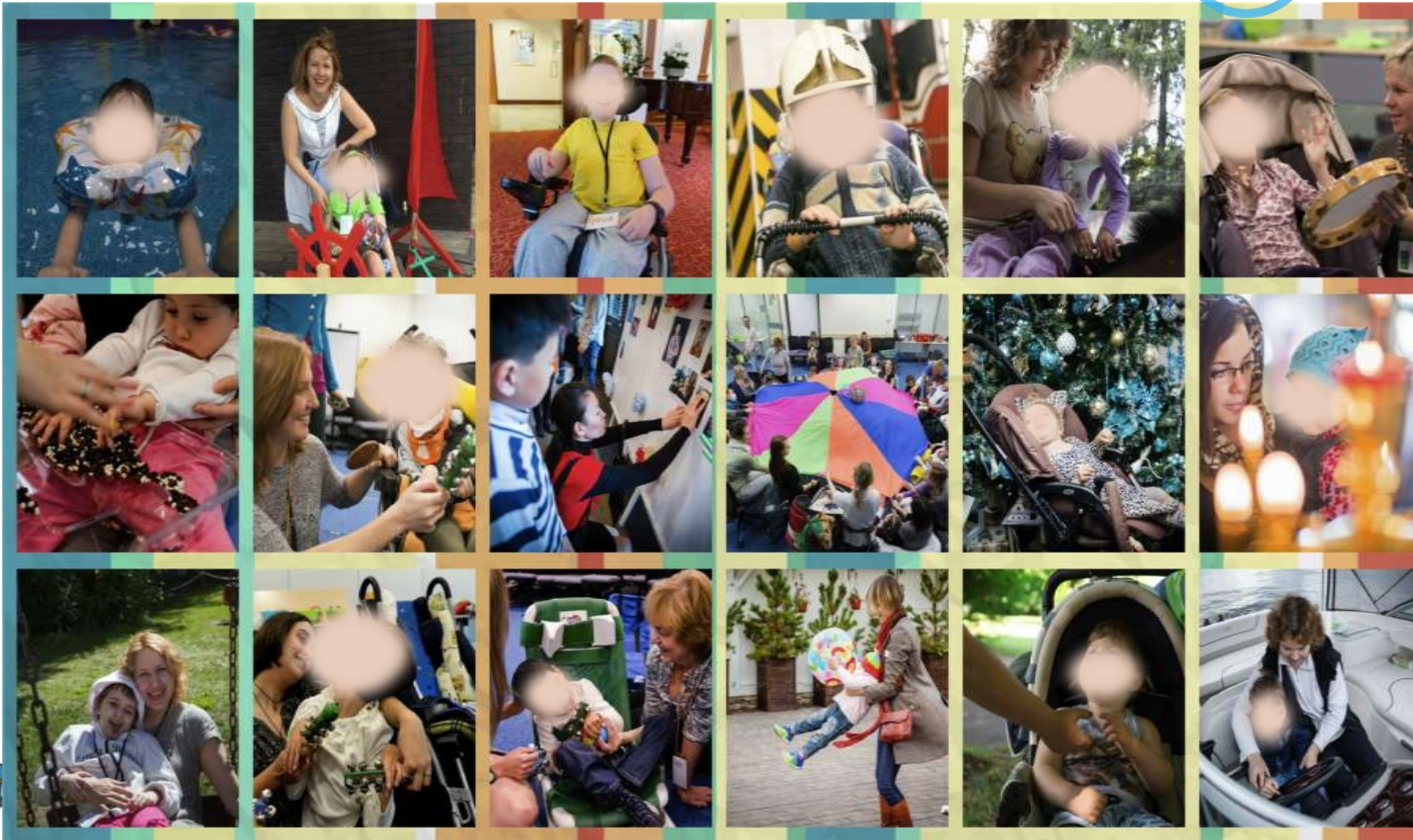
первый детский хоспис в москве