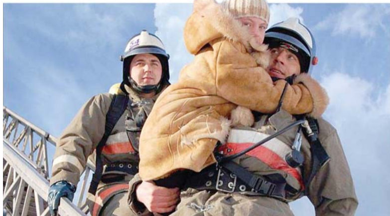
В 31% случаев дети гибнут в огне из-за шалости.

Спички - не игрушка - судя по всему, многие самарские родители забыли объяснить детям это простое правило безопасности. Статистика чрезвычайного ведомства говорит о том, что более 30% пожаров в которых погибли несовершеннолетние, возникли из-за детских шалостей с огнем. Последняя трагедия, которая унесла жизни сразу двух детей